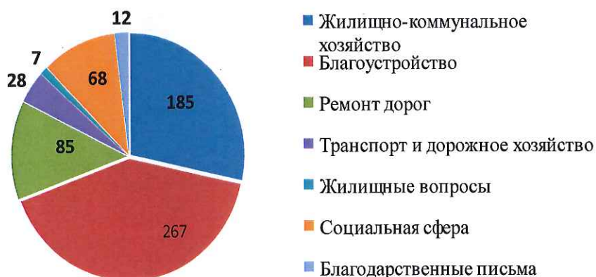
Основные темы обращений граждан в 2023 году

Следует отметить, что в сравнении с 2022 годом вопросы благоустройства вышли на первое место. Обустройство общественных пространств в рамках программы Формирование современной городской среды, переходящее из центра города на его окраины, широкое информирование о возможностях комплексного обновления дворов не оставляют горожан равнодушными. Жители вносят все больше предложений о необходимости озеленения и опиловки деревьев, освещения территории, установки малых архитектурных форм, устройства пешеходных дорожек.