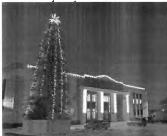
«Елка у ДК «Рудничный»