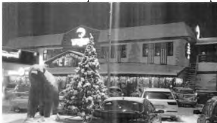
У ресторана «Тайга»