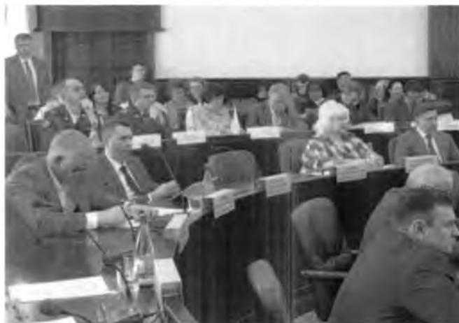
«Сессия Липецкого городского совета депутатов IV созыва»

1. Участие в работе городского совета – 10 заседаний Сессии городского Совета депутатов IV созыва.