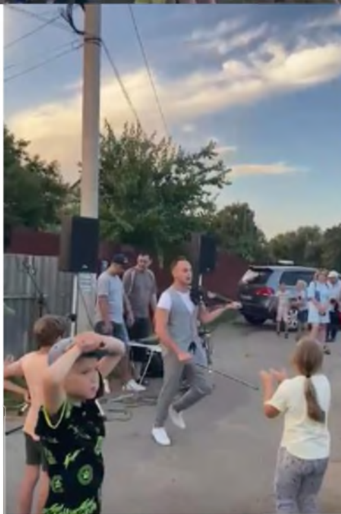
- поздравление выпускников МБОУ СШ № 9