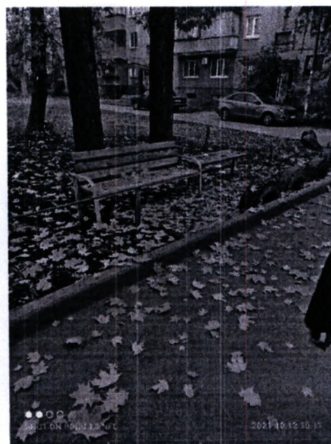
ул. Пушкина, д.13– ограждение палисадника, установка скамеек, детского оборудования;